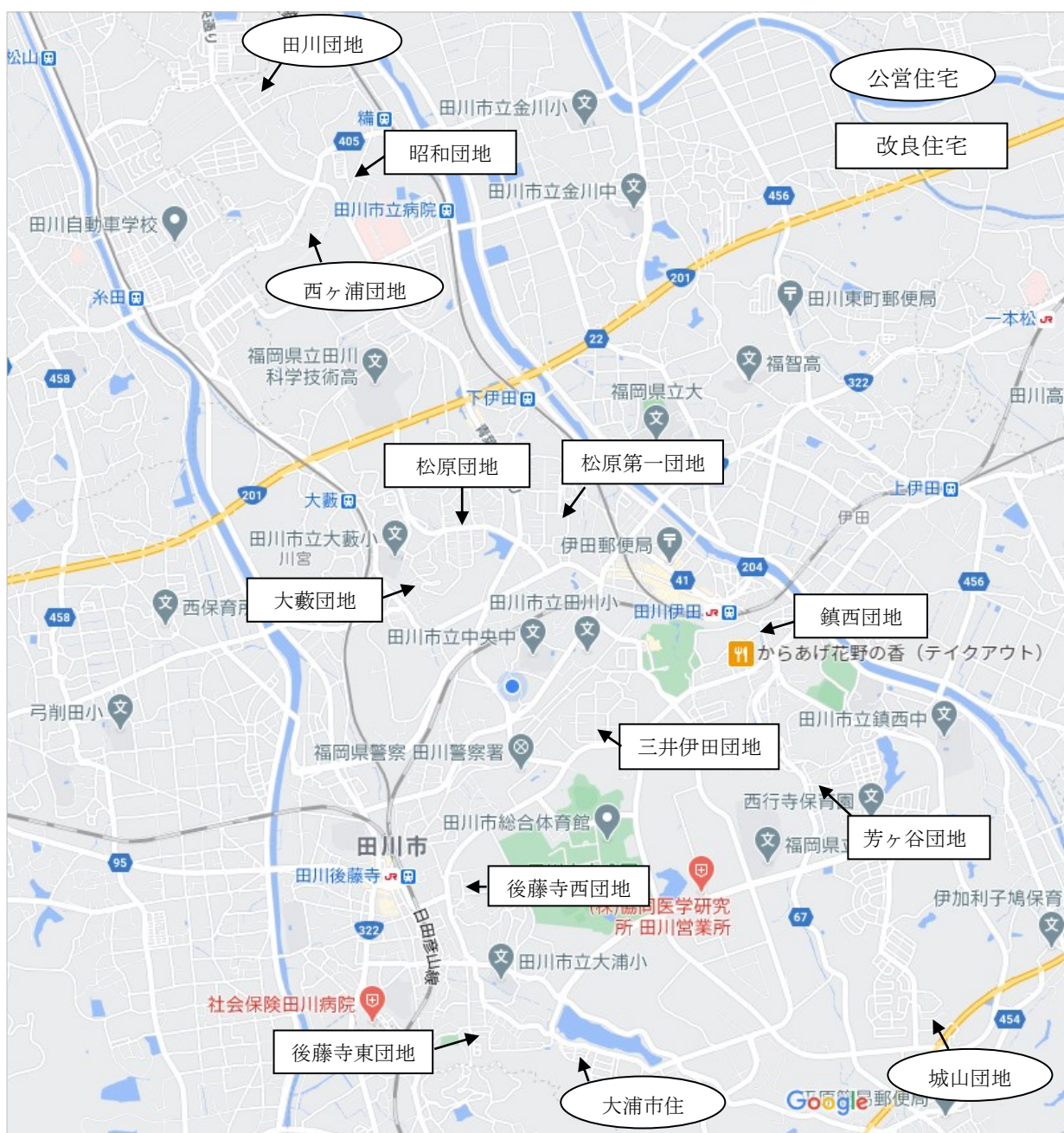
田川市営住宅配置図(募集団地用)

※市営住宅の配置図と詳細な間取り図は弊社の HP http://www.jkk.ecnet.jp/ より御覧いただけます。